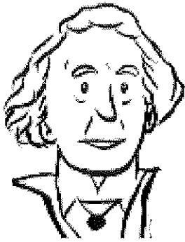
John A. MacDonalld

Associe les mots avec la bonne définition. Tu trouveras les réponses dans ce document.