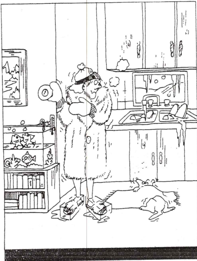
* Le droit au chauffage et à l'eau courante.