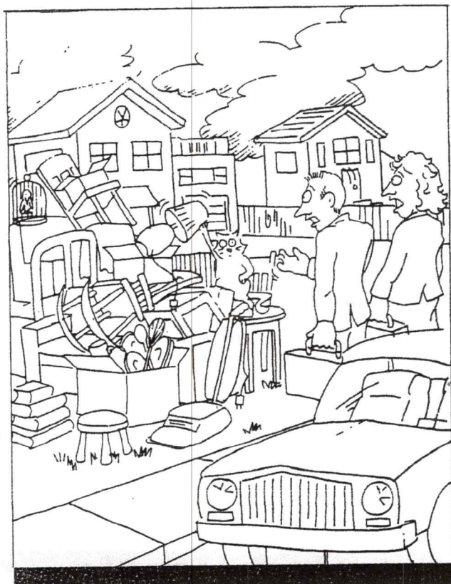
* Le droit d'être expulsé selon les règles prescrites.