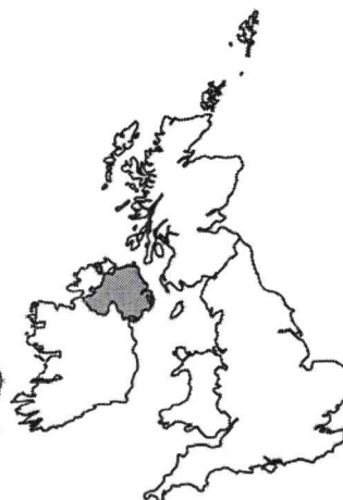
Irlande du Nord

Utilisez ces informations pour répondre aux questions suivantes.