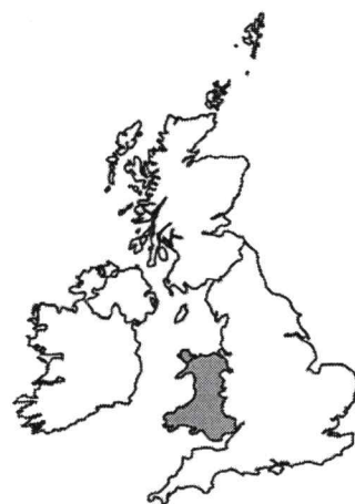
Pays de Galles