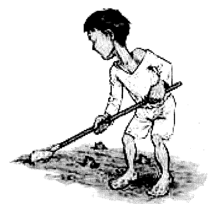
Le travail des enfants est une forme d'abus.

Ces enfants ont d'abord travaillé aux travaux de la ferme, mais vers le milieu du 20e siècle, l'industrialisation et l'urbanisation vont permettre d'utiliser les enfants dans les mines et les industries. La plupart travaillent dans des conditions dangereuses. Trop souvent, ils mettent leur santé et leur vie en danger. Ils occupent des emplois sans avenir, bien sûr mal payés, sans avancement. Ces enfants sont condamnés à rester pauvres et analphabètes toute leur vie.