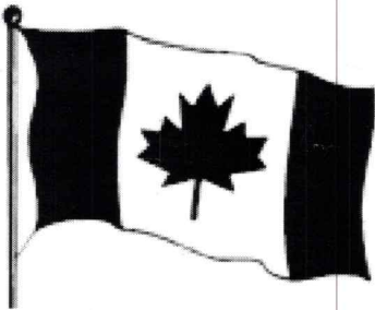
Le 15 février 1965, le drapeau canadien, que l'on connaît aujourd'hui, flotte pour la première fois sur la colline du Parlement à Ottawa.

En 1867, le gouvernement britannique accepte que les quatre colonies (le Nouveau-Brunswick, la Nouvelle-Écosse, l'Ontario et le Québec) s'organisent sous un gouvernement, tout en restant fidèle à la Grande-Bretagne. Cette union se nomme la Confédération du Canada. Depuis 1867, six autres provinces et trois territoires ont aussi décidé de se joindre à notre Confédération.