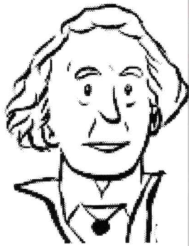
John A. MacDonald

Associe les mots avec la bonne définition. Tu trouveras les réponses dans ce document.