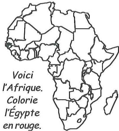
Voici l'Afrique. Colorie l'Égypte en rouge.