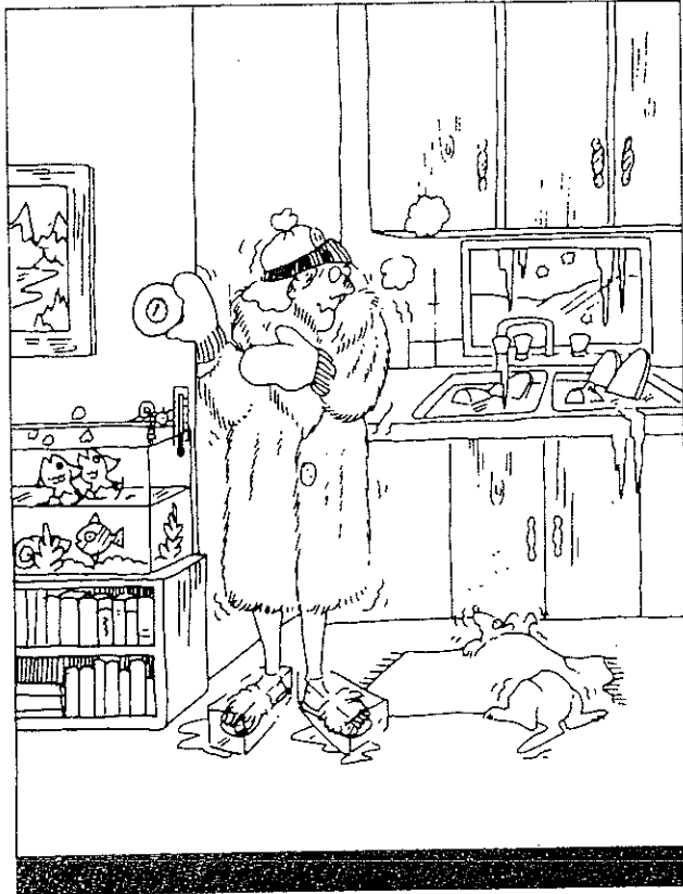
* Le droit au chauffage et à l'eau courante.