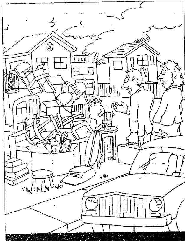
* Le droit d'être expulsé selon les règles prescrites.